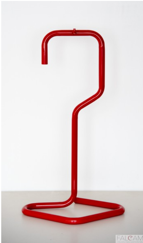
Base ROMBO - rosso RAL 3002