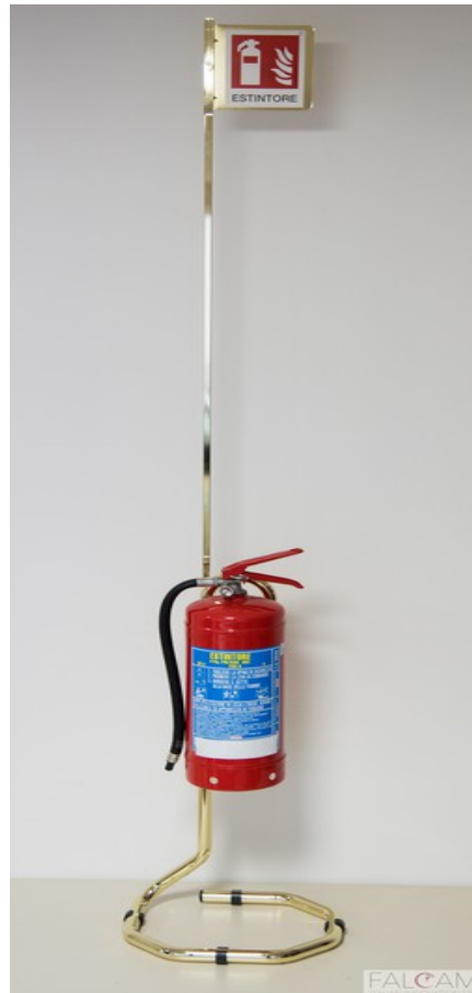
CROMO ORO LUCIDO