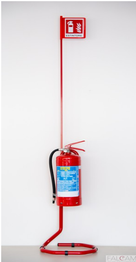
OCTAGON 180 - ROSSO RAL3002