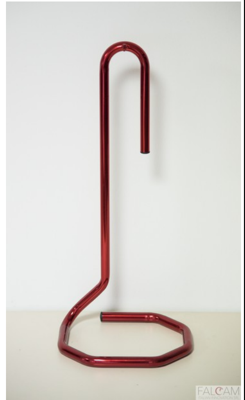
OCTAGON 180 - CROMO ROSSO GLOSSY

Il design e i colori delle nostre piantane sono stati selezionati per gli ambienti più prestigiosi : teatri, musei, chiese palazzi storici, studi professionali, residenze di prestigio di stile antico o moderno, sono solo alcuni esempi.