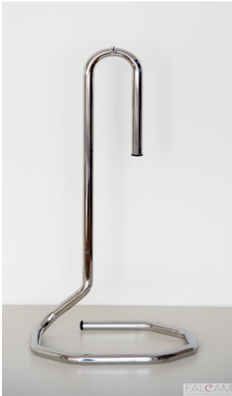
OCTAGON 180 - CROMO INOX