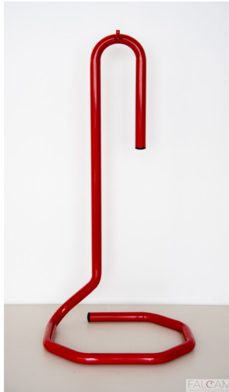
NUOVA OCTAGON 180 brevetto di design europeo